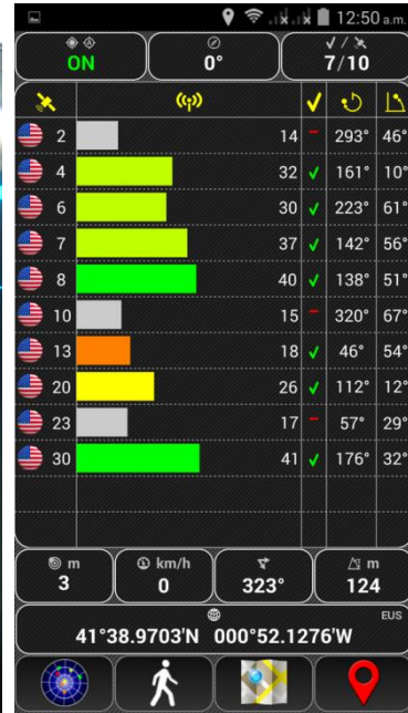
GPS Bien configurado